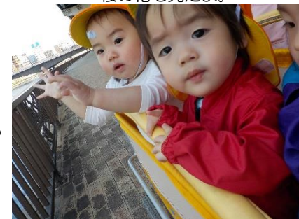
春風、気持ちいいね。