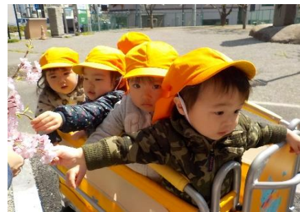
桜の花も見たいよ。