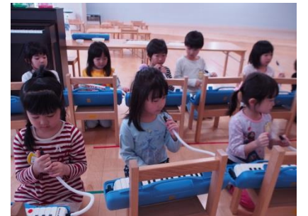
鍵盤ハーモニカに集中してます