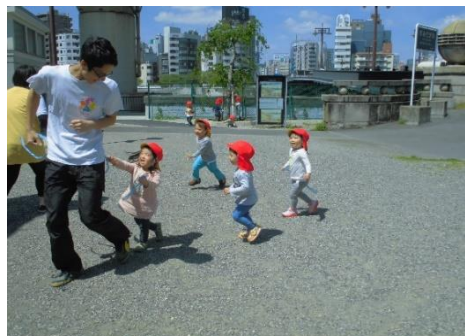
児童遊園でヨーイドン！