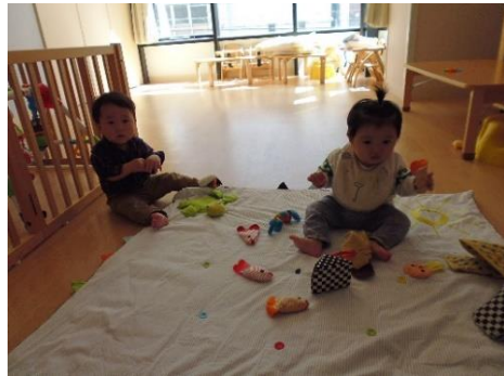
お座りして遊べるよ。

入園して早くも1ヵ月。最初は環境に戸惑い、不安で泣いていた子どもたちでしたが、少しずつ保育園での生活や保育者に慣れ、日に日に笑顔を見せてくれることが増えてきました。保育室では、周りの様子をじっと観察して興味ある玩具に手を伸ばして遊んだり、すり這いやよちよち歩きで探索をしたりしています。「あー」と声を出して自分の気持ちを主張する姿も見られたりしています。