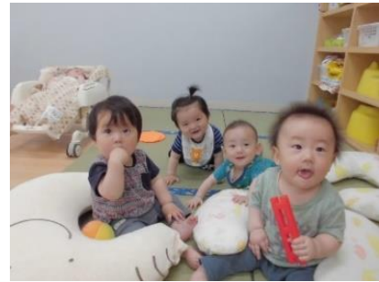
お友だちが大好き！

お天気の良い日には散歩に出て、心地よい風を感じながら外気浴を楽しみ、視覚、聴覚、蝕覚、嗅覚で自然や季節を感じて、子どもたちの感性を育ていけるよう援助しました。お部屋では、友だちの存在に関心を持ち、近くに移動して集まり、おも遊ぶ姿も見られています。