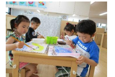
真剣に筆を使って表現したよ

進級当初に比べると、子どもたちとの信頼関係が築けてきたように思ひます。いろいろなことを理解し4歳児として頑張ろうとする姿をたくさん見せてくれるゆいぐみの子どもたちです。これから梅雨期に入ると室内で過ごす時間が多くなってきますが、環境設定を考えながら、また新しい遊びや少し難しく「挑戦したい!」と思えるような活動を楽しみたいと思ひます。担任