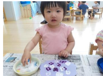
あじさいスタンプ「キュパッ」