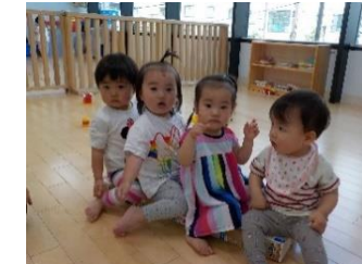
室内あそび「バスごっこ」の歌にのせて