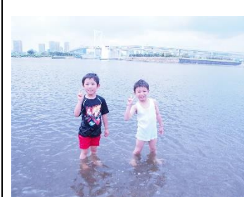
レインボーブリッチだよ

先日は、親子遠足にご参加いただきましてありがとうございました。皆で大型バスに乗ったり、「日本科学未来館」で地球のジオラマやロボットを見て、地球・宇宙・科学の神秘さや不思議さに触れたり、「海浜公園」で美味しいお弁当を食べ、貝殻拾いや水遊びをしたりお家の方や友だちと一緒に楽しく充実した一日を過ごせたと思ひます。6月には、プラネタリウム見学を予定していますので、さらに神秘的な世界観への興味・関心を深められるようにしていきたいと思ひています。