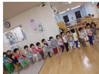
並ぶのが上手になったよ。