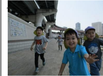
隅田川テラスでかけっこ

先日は遠足ごっこを行いました。リュックを作り、中にはお弁当や水筒、好きなものをクレヨンで描いて遊びました。梅干し弁当やたこさんウィンナー、ミックスジュースなどお友だちと交換しながら食べる子、長縄電車に乗り切符を持って乗るなど園内遠足をととても楽しんでたすみれさん。お兄さんお姉さんが遠足から帰