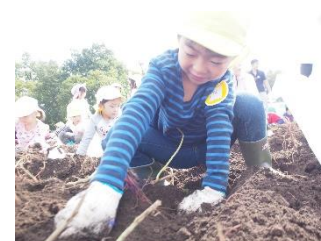
大きなおいも 「あった！」

12月は、今子どもたちが夢中になって楽しんでいる劇遊びや楽器あそびをより発展させていきたいと思います。