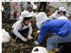
おいもはどこかな？

絵本や図鑑を見ながら、「どんなお芋があるかな？」「早く行きたい！」といもほり遠足当日を心待ちにしていた子どもたち。そんな子どもたちの期待に応えるかのような秋晴れの下、ひまわりぐみと一緒に芋ほりと大根抜きを体験してきました。到着してすぐは、普段目にする事のない広い畑に圧倒され、土の触り方も恐る恐ると言った雰囲気だったのですが、保育士が「もっと奥まで掘らないとお芋は出てこないよ！」と声をかけると、それまでの姿が嘘だったかのように、ダイナミックに芋ほりを楽しんでいたゆりぐみでした。お母さんたちもみんな嬉しそうに見せ合っていました。