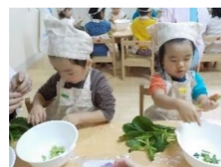
真剣に小松菜ちぎりをしています

12月は、表現活動や簡単なルールを取り入れた集団遊び、身体を使ったリズム遊びなどを行っていききたいと思います。