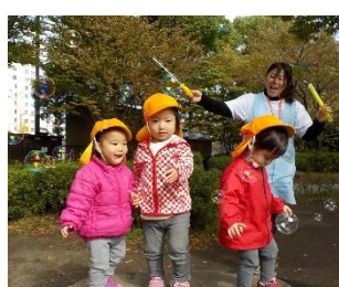
しゃぼん玉楽しいな！