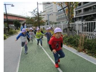
ヨーイドン全速力だ！

来月は、劇あそびやリズム遊びを活動に多く取り入れ、友だちと一つのものを作り上げていく楽しさや、音楽に合わせて身体を動かすことの楽しさを感じられるように働きかけていきたいと思います。