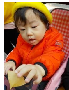
きれいな銀杏のはっぱだよ。

12月には、発表会があります。初めての発表会に驚いてしまう姿もあるかもしれませんが、温かく見守っていただけたらと思います。