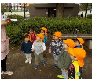
これからなにが始まるの？

たり見守ったりしながら、「自分でできた」満足感、達成感を味わえるように援助していきたいと思います。また、発表会に向けての取り組みもはじまり、楽しみながら歌ったり、体を動かしたりして表現する姿が見られています。一人ひとり楽しく表現遊びが行えるように無理のないペースで進めていきたいと思っています。